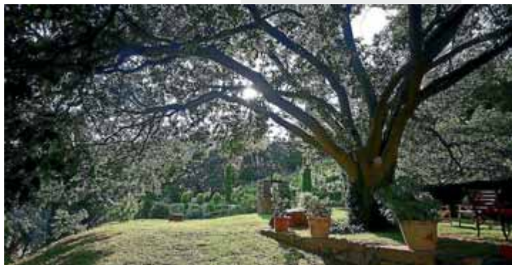
Racó del parc de Vallmanya, situat a Sant Esteve de Palautordera.

l'entrada és de 5 euros. S'hi convida els visitants a combinar diversos brots de plantes aromàtiques, fregar-los amb les mans perquè desprenguin els olis essencials i descobrir les propietats de cada espècie. L'emblema del parc és el romaní, amb el qual elaboren productes de cosmètica natural. Per concertar visites es pot trucar al telèfon 93 865 60 81.